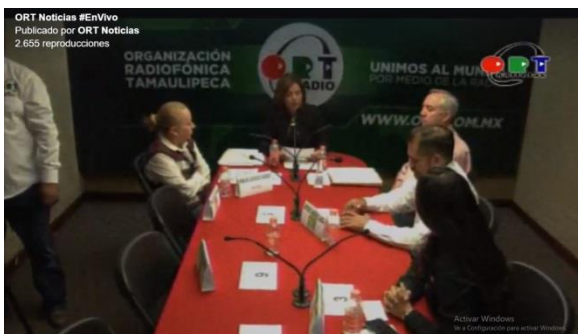
Tabla 7.- Debates organizados por Organización Radiofónica Tamaulipeca (ORT)