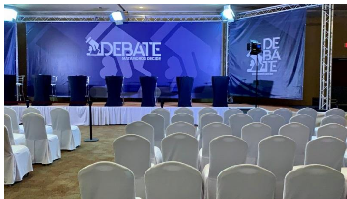
Tabla 6.- Debates organizados por Radiodual S.A. de C.V.