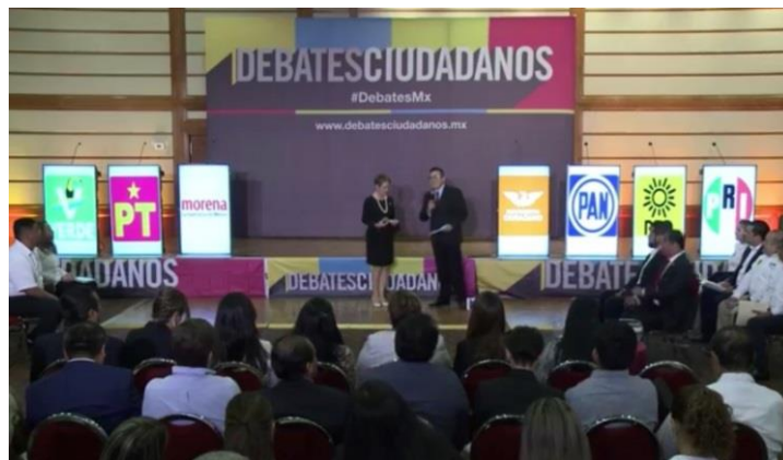
Tabla 5.- Debate organizado por COPARMEX, CANACO, AMPRAC, CMIC, IMCP y Universidad Tamaulipeca